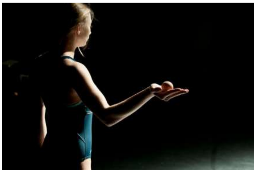
Laboréal es 2013

À l'issue de cette représentation, nous proposons un échange entre le public et l'équipe artistique, animé par un autre artiste de la saison. L'occasion pour les spectateurs d'interagir avec les artistes!