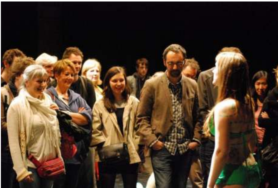
Laboréales 2013

Une pièce incongrue où les performeurs comme les spectateurs s'interrogent sur ce qu'ils attendent du théâtre : quels sont leurs espoirs, leurs exigences ou leurs motivations. Et surtout, pourquoi se sont-ils, les uns et les autres, donnés rendez-vous ce soir ?